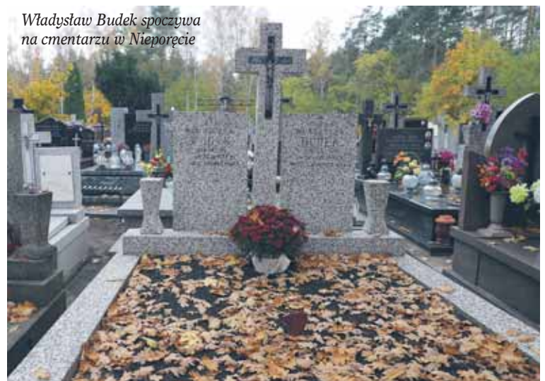
Władysław Budek spoczywa na cmentarzu w Nieporęciu

wybrano widoczne, piaszczyste, suche wzniesienie przy drodze fortecnej Zegrze – Rembertów. Być może mógł być tam również pochowany ppor. Benedykt Pęczkowski, nie mam jednak jeszcze potwierdzenia tego faktu w źródłach. W późniejszym okresie oficerowie zostali ekshumowani i pochowani w grobach rodzinnych na cmentarzu przy ul. Parkowej w Łodzi, a żołnierze w kwaterach na cmentarzu wojennym 1920 roku w Radzyminie.