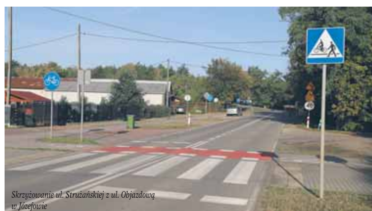
Skrzyżowanie ul. Strużańskiej z ul. Objazdową w Józefowie