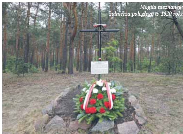
Mogiła nieznanego żołnierza poległego w 1920 roku