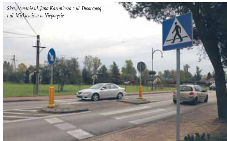
Skrzyżowanie ul. Jana Kazimierza z ul. Dworcową i ul. Mickiewicza w Nieporęcie