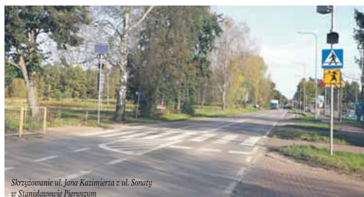
Skrzyżowanie ul. Jana Kazimierza z ul. Sonaty w Stanisławowie Pierwszym