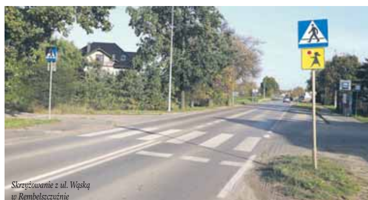
Skrzyżowanie z ul. Wąską w Rembelszczyźnie