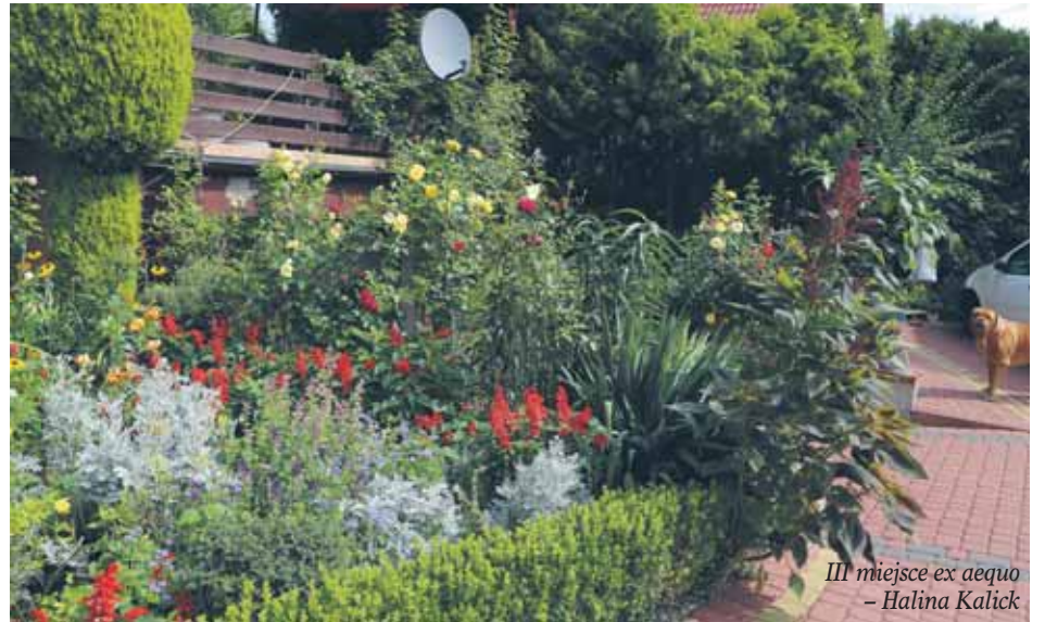
III miejsce ex aequo – Halina Kalick