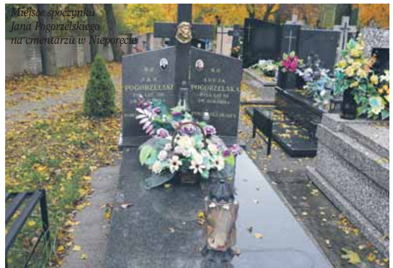
Miejsce spoczynku Jana Pogorzelskiego na cmentarzu w Nieporęciu